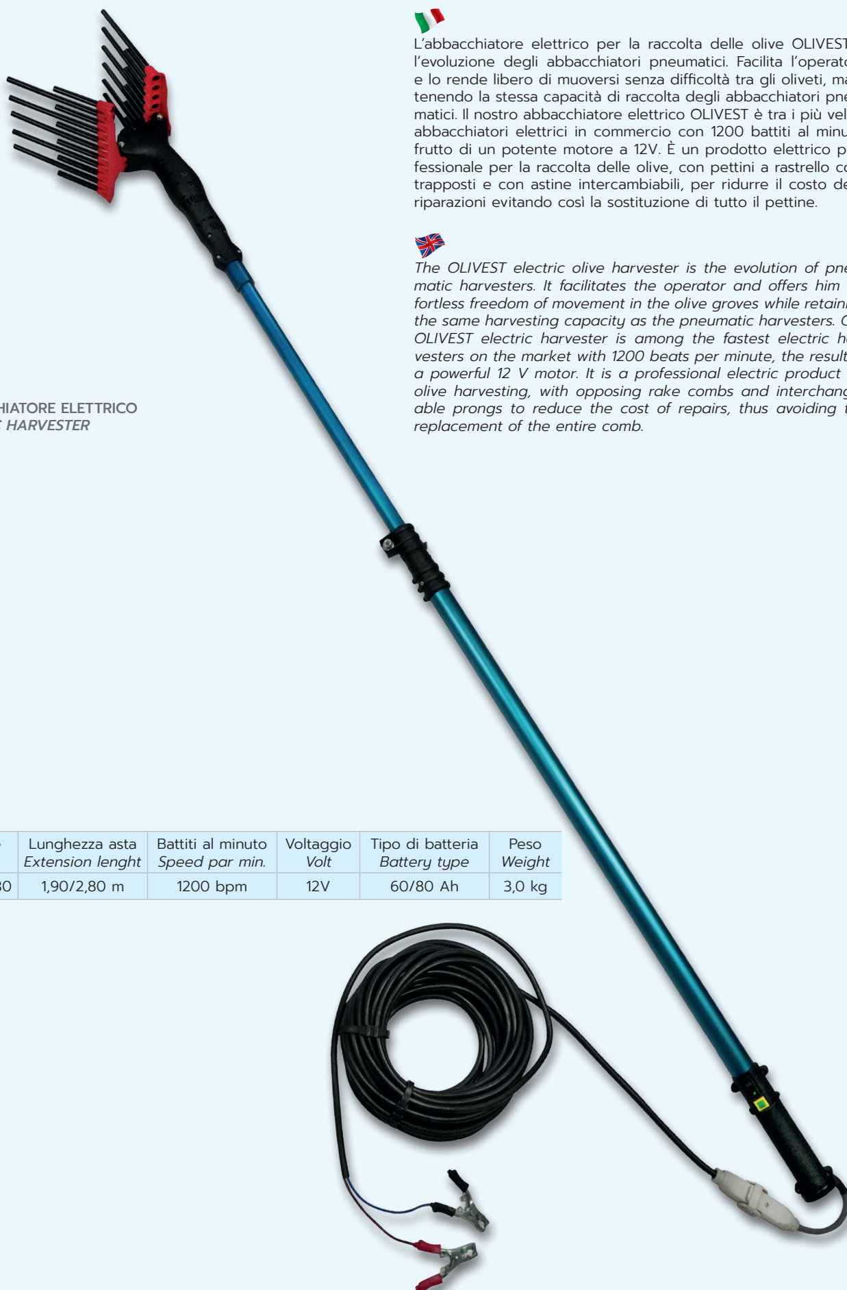
ABBACCHIATORE ELETTRICO ELECTRIC HARVESTER