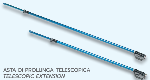
ASTA DI PROLUNGA TELESCOPICA TELESCOPIC EXTENSION